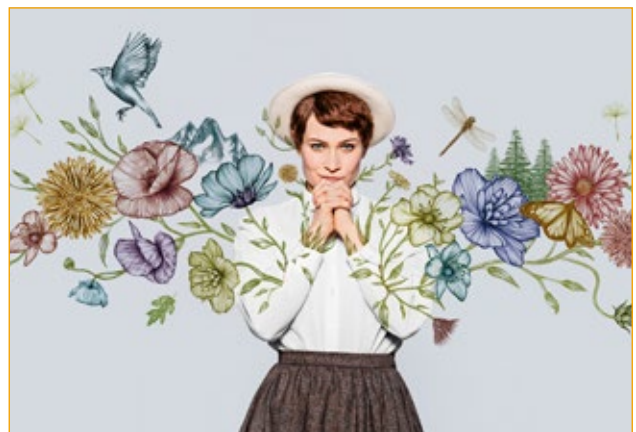
Ill: Julia Szulc

Pris: 300 kr för medlemmar och icke medlemmar 600 kr